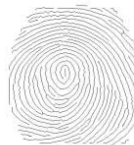
Extraction des minuties