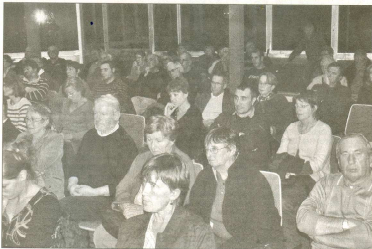
Dans l'auditoire, pas ou peu d'interventions sur des sujets qui fâchent.

Plus sérieusement, il s'est montré plutôt convainquant