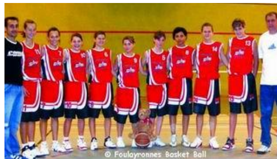
remarquez la prise de vue de la photo Rien à voir avec le style scolaire 1940-1960 en triple rang.