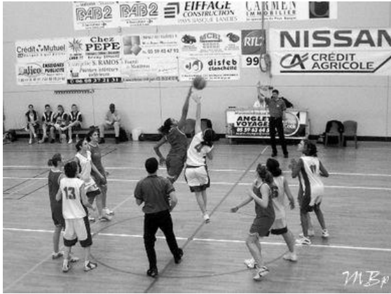
5 cadettes contre Pessac/La Brede/Gazinet