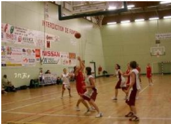
5 cadettes contre Pessac/La Brede/Gazinet