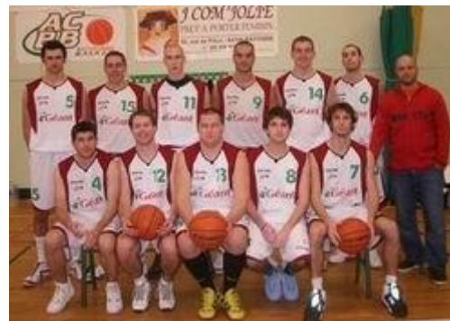
5 seniors garçons 07-08