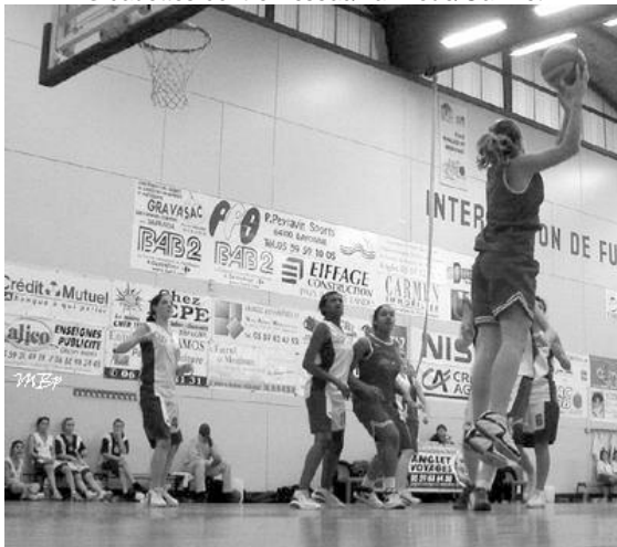
5 cadettes contre Pessac/La Brede/Gazinet