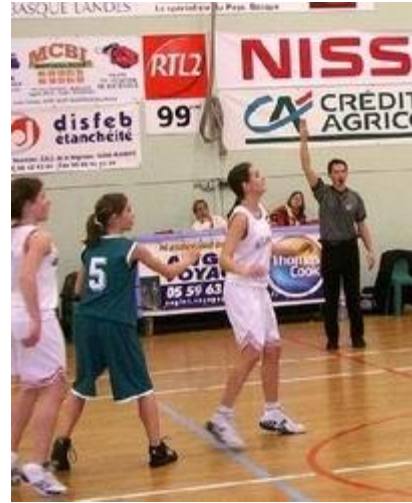
5 MF contre Moulin neuf