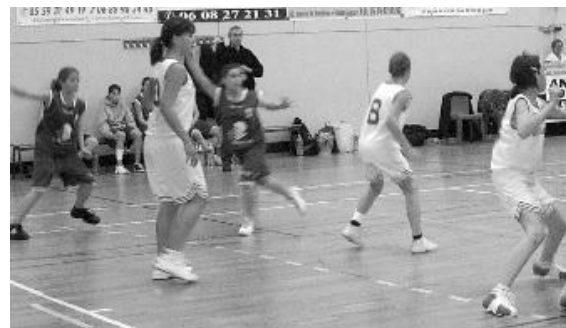
5 MF contre Moulin 9