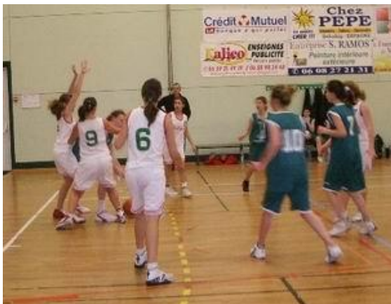
5 MF contre Moulin 9