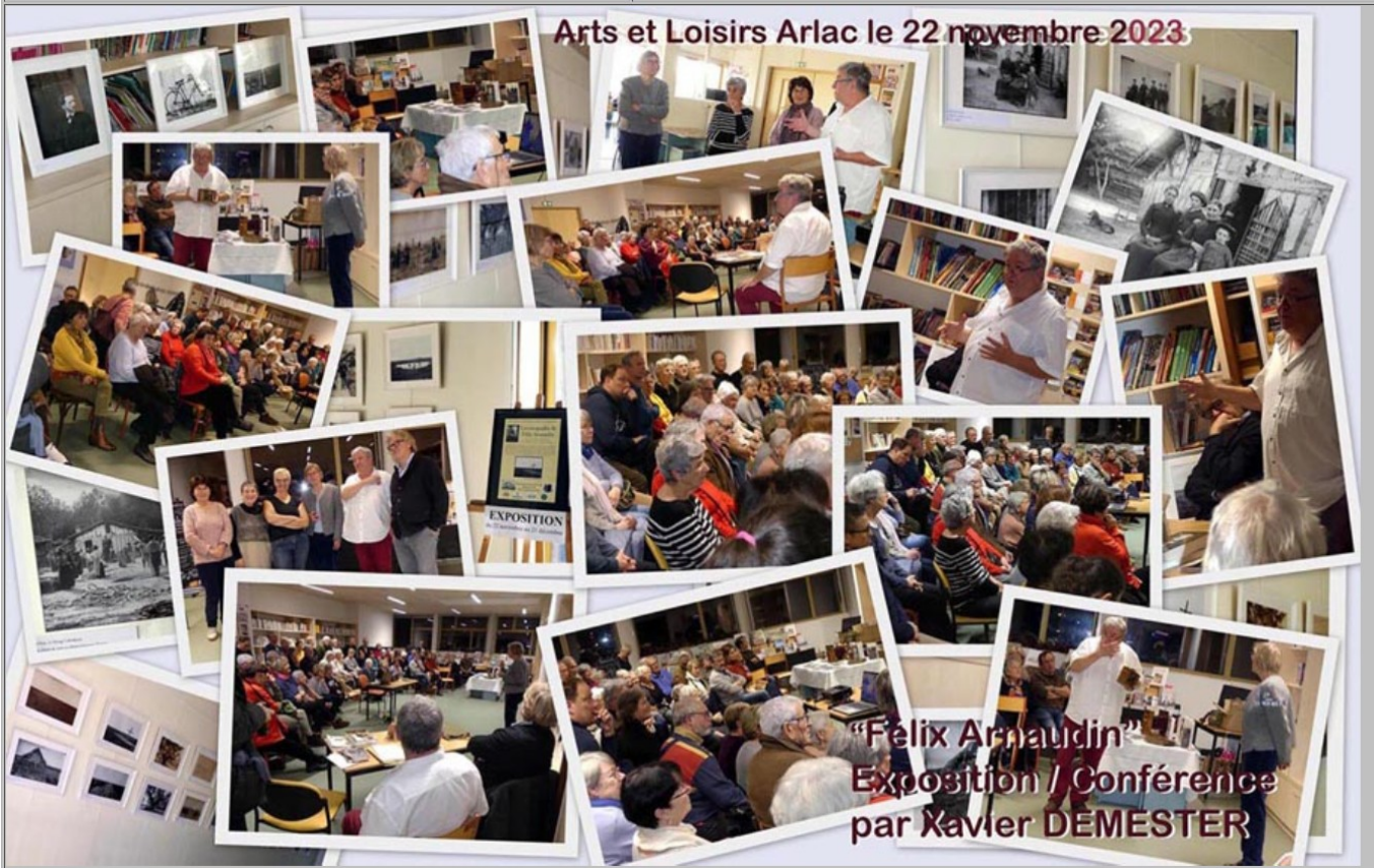
"Félix Arnaudin" Exposition / Conférence par Xavier DEMESTER