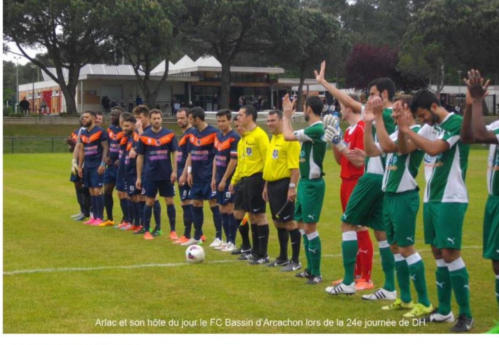
Arlac et son hôte du jour le FC Bassin d'Arcachon lors de la 24e journée de DH.