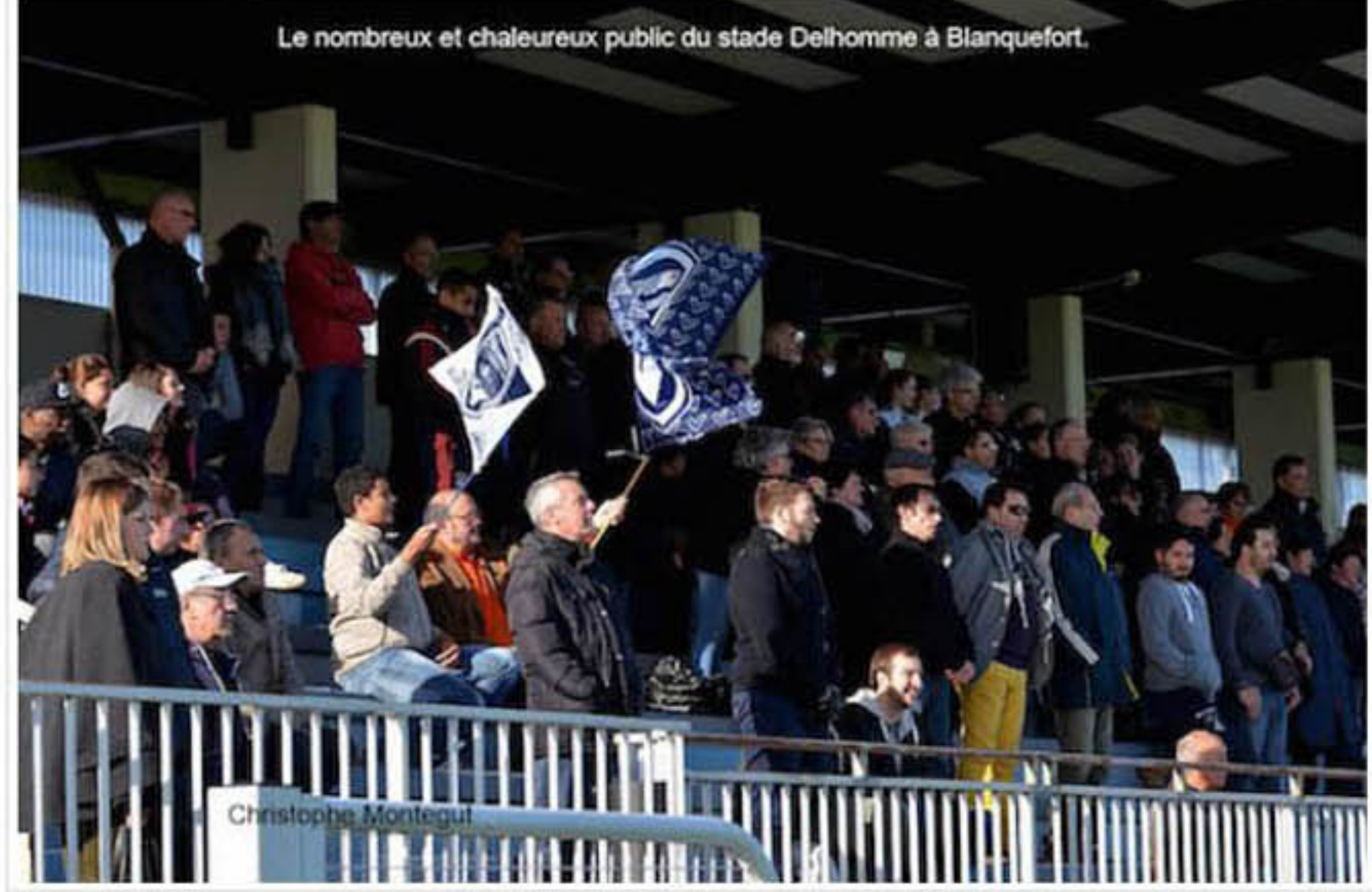
Le nombreux et chaleureux public du stade Delhomme à Blanquefort. Christophe Montegut