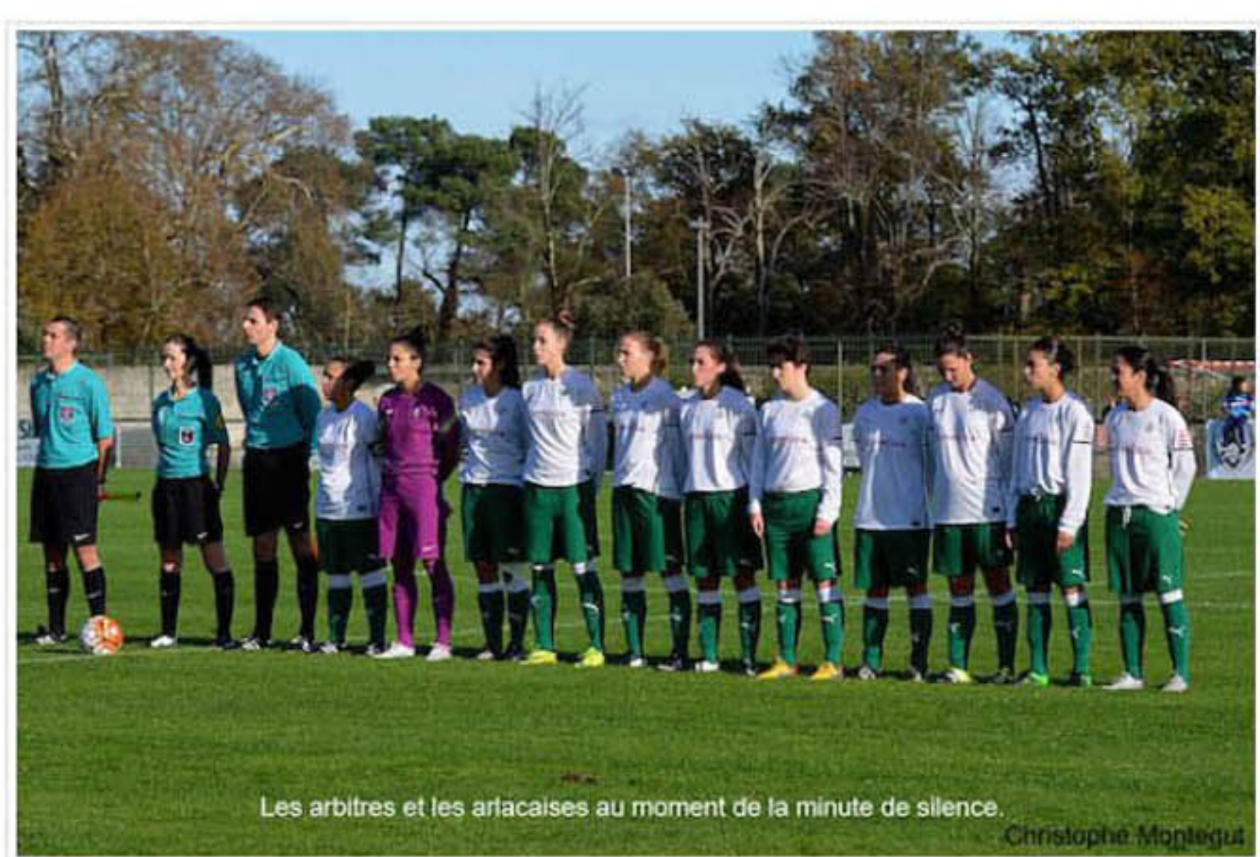
Les arbitres et les arlacaises au moment de la minute de silence. Christophe Montegut

Les Girondines l'ont emporté sans contestation par 3 buts à 1 contre les Arlacaises ce dimanche 22 novembre. Le grand gagnant a été le football. Les Bordelaises ont gagné cette rencontre, dans les dix premières minutes de la partie, et les Mérignacaises l'ont peut-être perdue dans les vestiaires, faute de ne pas s'être libérées.