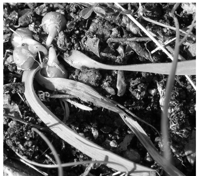
Photo 3 (à droite). Allium chamaemoly à Talza (Figari, Corse-du-Sud) le 20 mars 2005.