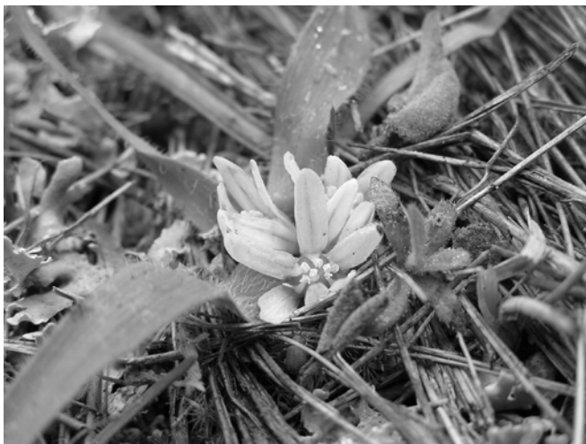
Photo 2 (ci-dessus). Allium chamaemoly à l'Escalette (Marseille, Bouches-du-Rhône) le 20 mars 2004.

À l'instar de la Camargue, l'extrémité ouest du massif de la Nerthe, depuis la pointe de Bonnieu et sa plaine jusque vers La Couronne, présente de très importantes populations. Ces dernières sont toutefois connues de longue date (MOLINIER, coll. MARTIN, 1981). Dans le reste du massif, l'espèce semble disséminée, mais a été peut être sous-observée. Elle a été notée aux alentours de Sausset-les-Pins (à l'est comme à l'ouest du village) ainsi qu'à proximité de Gignac-la-Nerthe (ouest du village avant le quartier de Laure). Si les importantes populations de la plaine de Bonnieu (estimées à plusieurs milliers d'individus) semblent à ce jour