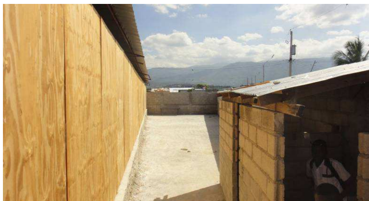
A l'emplacement des anciennes classes sous bâches, les nouveaux locaux provisoires avec charpente métallique et panneaux de bois.

Officiellement, la rentrée des classes a eu lieu le 4 octobre dernier en Haïti. A Fourgy, nous avons pu ouvrir le 11 octobre mais à la Cité Soleil, nous n'avons recommencé l'année scolaire qu'à la troisième semaine du mois d'octobre. Pourquoi tous ces retards? D'abord, les nouveaux locaux, toujours provisoires mais plus confortables, n'étaient pas encore prêts. En effet, nous avons définitivement abandonné les classes provisoires en plein air pour la raison première que les tempêtes d'août et septembre et les pluies diluviennes qui tombent habituellement durant la saison d'été ont eu raison des bâches et des poteaux de bois qui les constituaient. Nous avons prévu la construction d'une structure métallique légère recouverte de tôles et cloisonnée à l'aide de simples panneaux de bois, pouvant accueillir provisoirement huit salles de classes et destinée par la suite aux activités de la section Formation Professionnelle . L'organisme qui en assurait la mise en place avait pourtant prévu d'achever les travaux à la fin du mois de septembre. Mais hélas, nous avons subi de nombreux contretemps et ce qui aurait dû se faire en quinze jours a finalement pris un mois de temps. Quoi qu'il en soit, c'est dans des locaux un peu plus appropriés que s'est déroulée la rentrée scolaire à Cité Soleil et personne ne s'est plaint du retard, eu égard à la réelle amélioration des conditions d'enseignement.