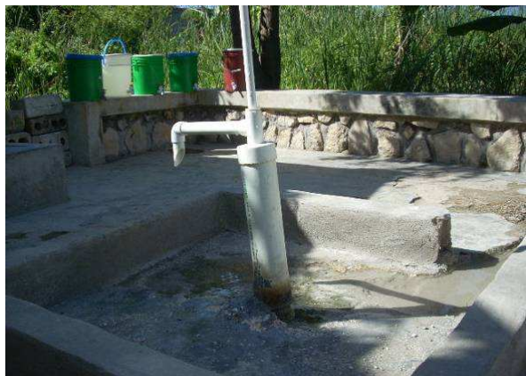
Le puits de Fourgy et les réservoirs d'eau de Cité Soleil.

En ce qui concerne les deux puits de Fourgy, ils avaient souffert du séisme et ont nécessité une réhabilitation complète. Ils ont dû être creusés encore plus profondément pour avoir accès à une eau plus abondante et de meilleure qualité. Un rehaussement et une pompe à main ont été installés sur le premier puits, alors que le deuxième est équipé d'une pompe électrique pour alimenter les réservoirs. A Cité Soleil, l'eau est livrée par abonnement dans trois grands réservoirs. Nous la traitons au chlore pour l'assainir.