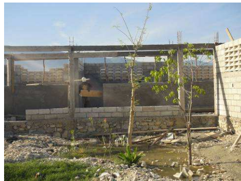
Du côté Préscolaire, les trois salles de classe et la galerie en bon état d'avancement des travaux.

Tout ceci n'est possible qu'avec votre aide fidèle et généreuse, partenaires, donateurs, Parrains et Mairaines. Soyez-en remerciés bien sincèrement et croyez en notre profonde reconnaissance.