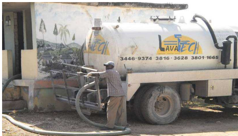
Vidange des latrines par une société spécialisée.

La vidange et le curage des latrines ont été faits par une société spécialisée, nous n'avons pas pu prendre cette fois-ci le risque d'un curage manuel.