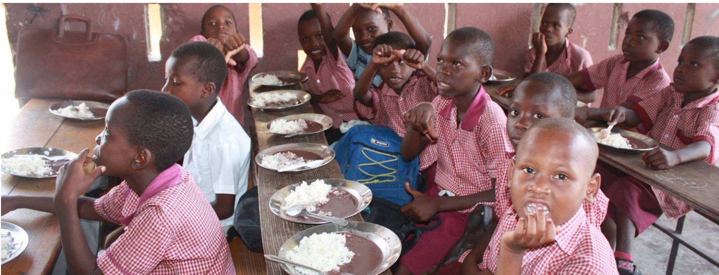
Cantine de Cité Soleil : les enfants attablés dans leur salle de classe