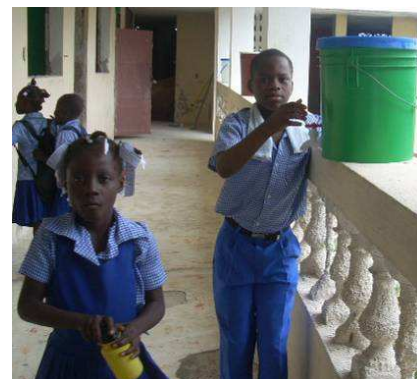
Les seaux de distribution d'eau de boisson.