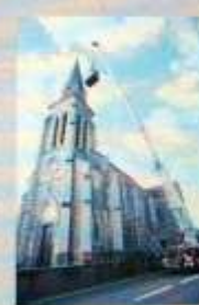
Eglise de Severac