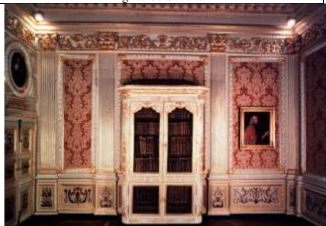
Restauration du bureau du Procureur Général en 1983