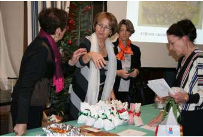
Est-ce le bon prix ?