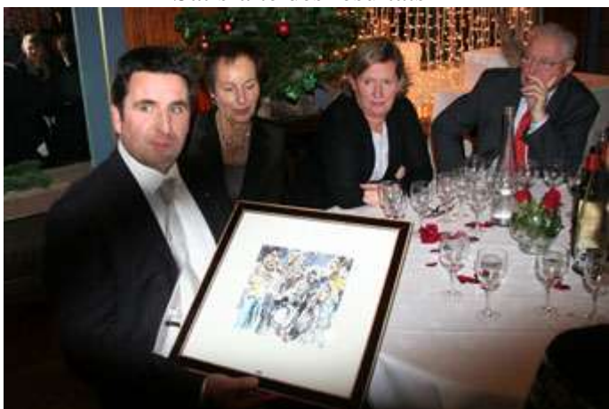
Un heureux attributaire