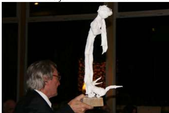
Le Petit Prince