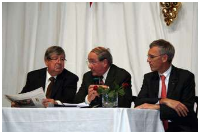
Nos 3 journalistes de service