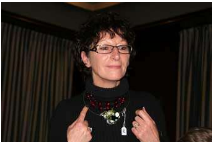
L'ai-je bien porté ?