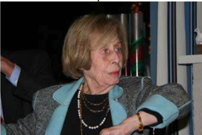
Inquiète de l'enchère