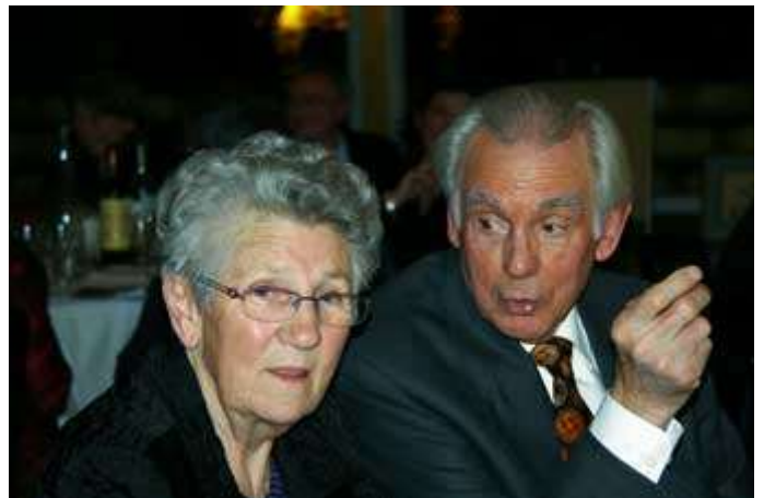
On renchérit ou pas ?