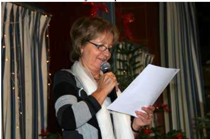
Satisfaite des résultats