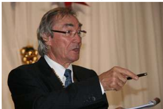
D'accord pour payer ?