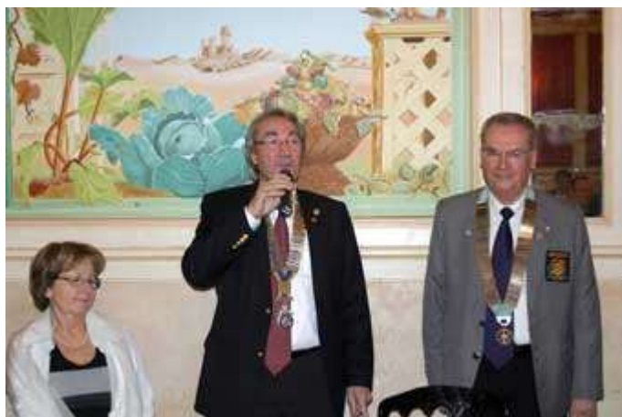
Notre Président l'accueille