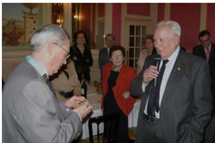
Le Parrain remercie son filleul