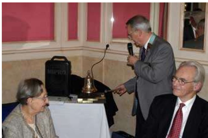
Le Gouverneur lance la soirée