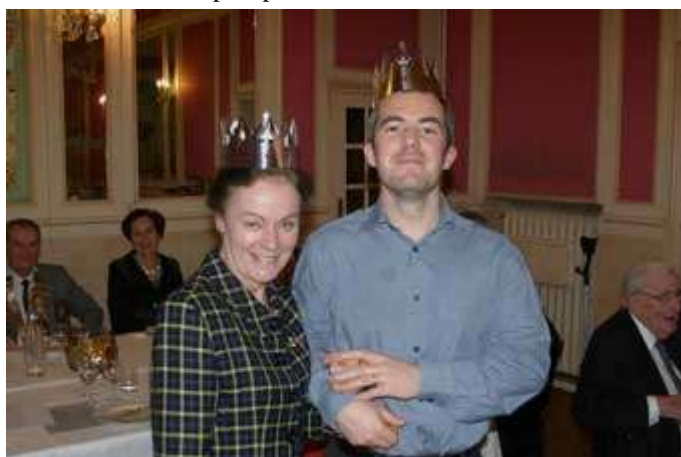
Le Roi et la Reine