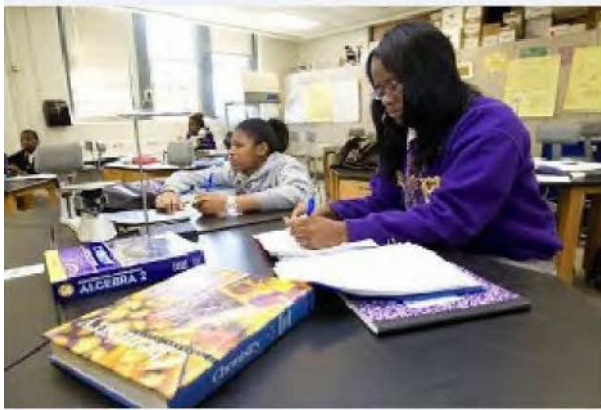
Des élèves dans l'un des laboratoires de sciences rénové.