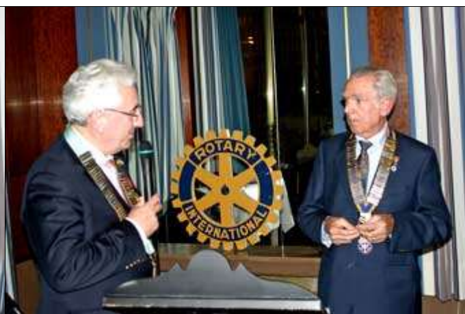
Discours du Gouverneur