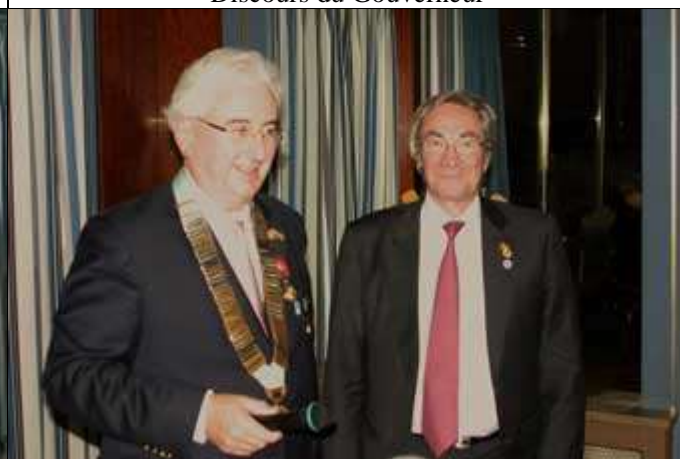
Et de l'autre