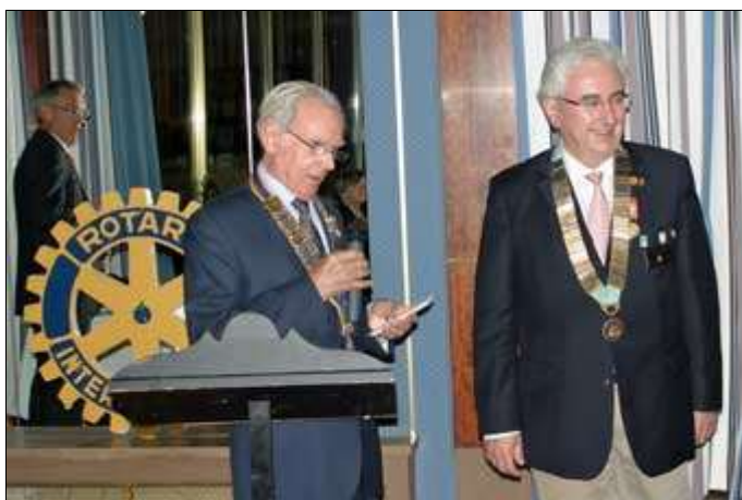
Accueil du Président