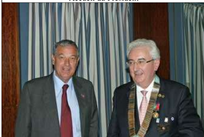
Décoration d'un parrain