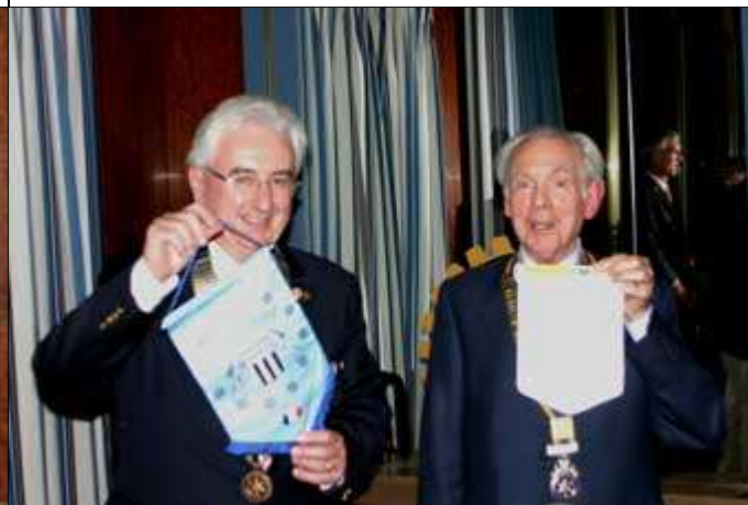
Echange des fanions