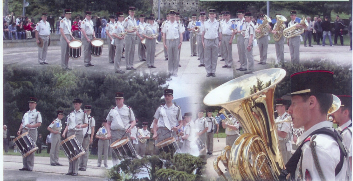
Le public Géorgien ayant une forte culture musicale, répond présent à chaque prestation.

La Musique a donné une aubade au pied de la citadelle de Gori, ville natale du Prince Dimitri AMILAKVARI, héros franco-géorgien, Lieutenant-colonel de la légion étrangère, chevalier de la Légion d'Honneur, Compagnon de la Libération, médaillé de la Croix de Guerre 39/45 avec palmes et de la Croix de Guerre des T.O.E avec deux citations. Gori est également la ville où Staline a vu le jour.