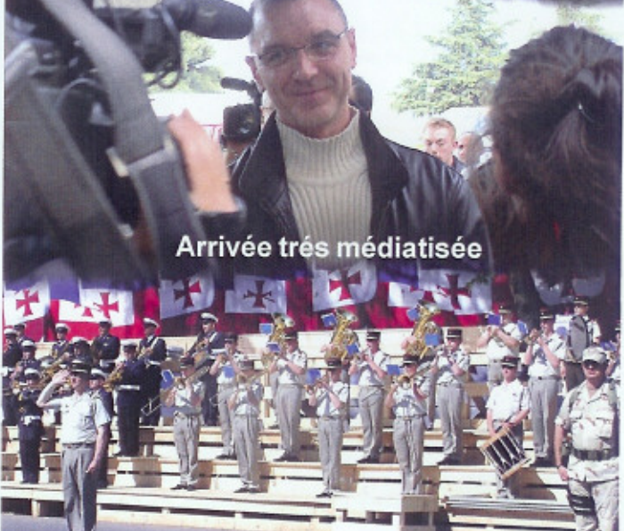
Arrivée très médiatisée