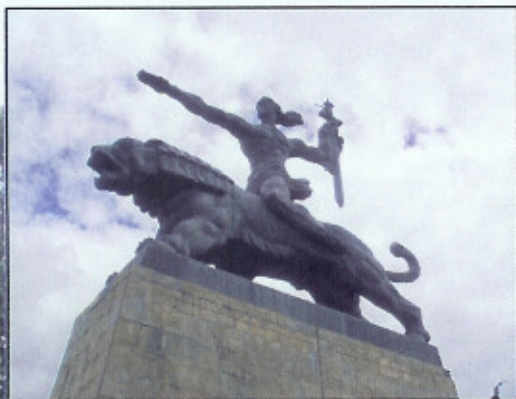
La statue de «David le Bâtitteur» symbole de la Ville de Gori.