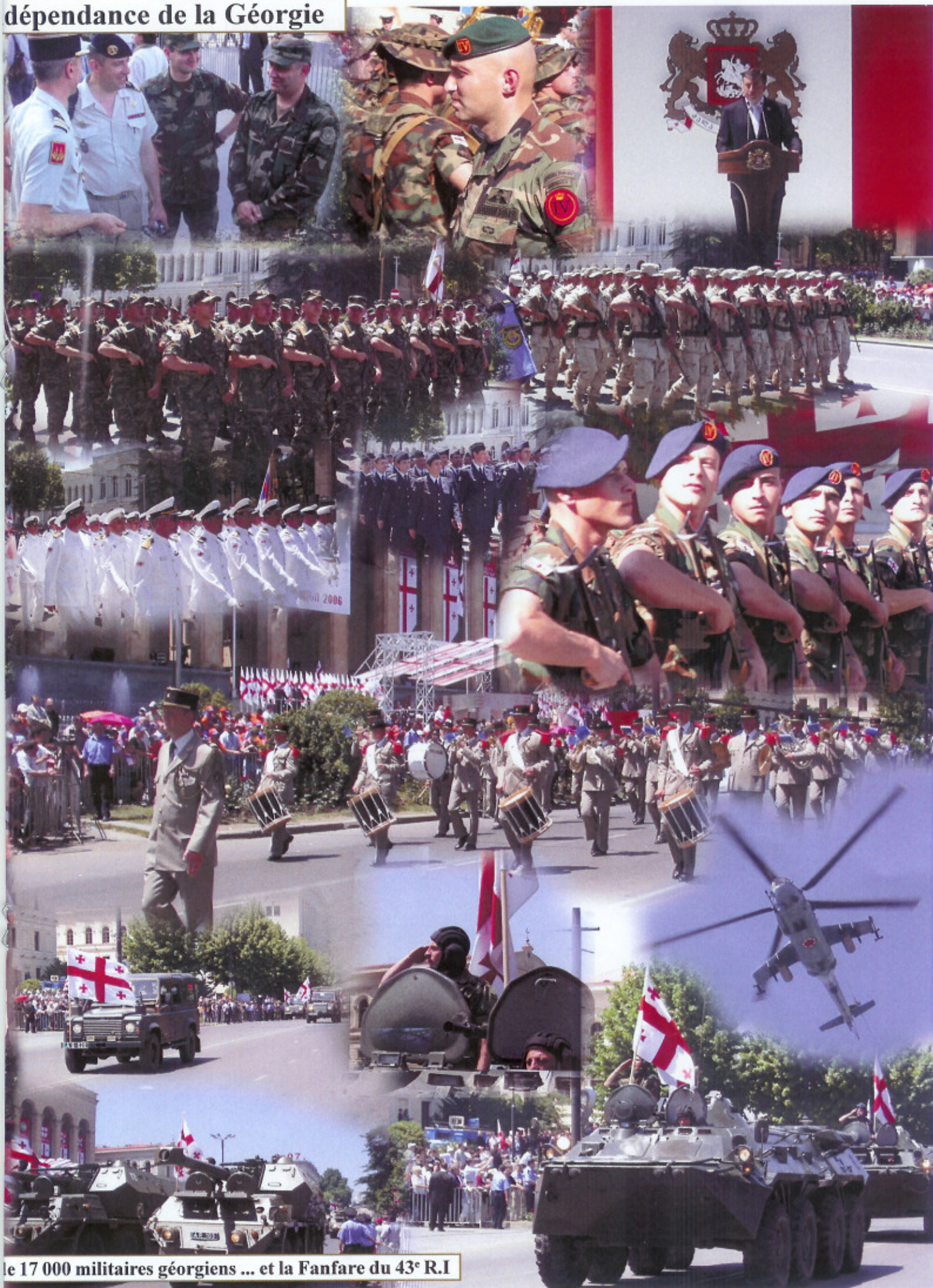
les 17 000 militaires géorgiens ... et la Fanfare du 43 e R.I