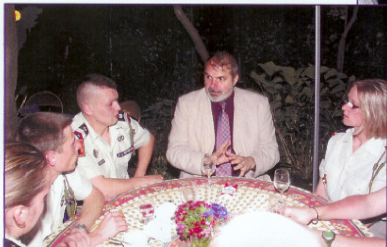
Ci- contre : L'ambassadeur à la table des musiciens.