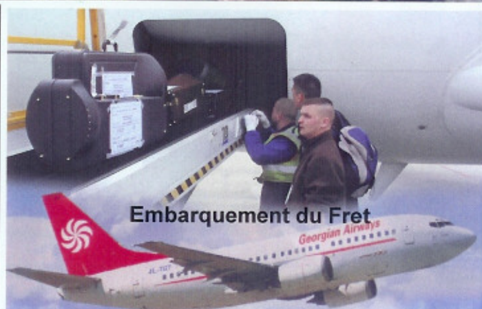
Embarquement du Fret