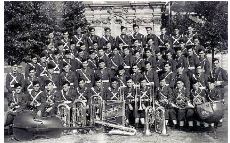
Musique de la Garnison de Lille en 1951

Plaquette créée par Michel Bocquet : michel-bocquet@hotmail.fr