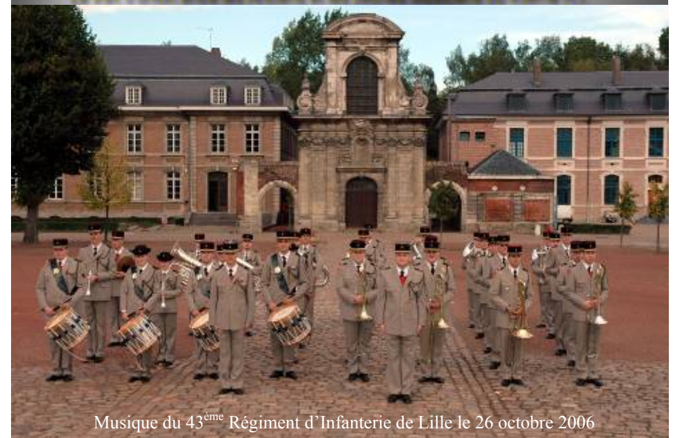
Musique du 43 ème Régiment d'Infanterie de Lille le 26 octobre 2006

Le trait d'union entre les Anciens et les Jeunes Musiciens du 43 ème R.I.