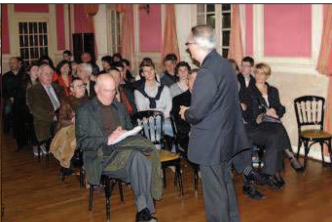
Vues de l'assistance