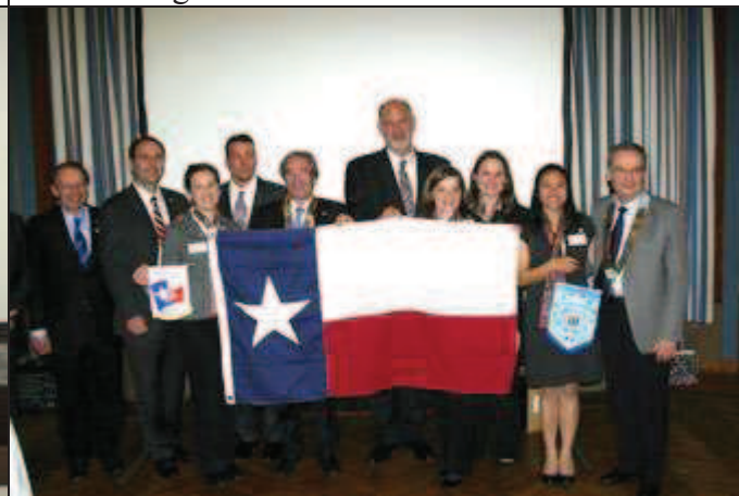
Le drapeau du Texas