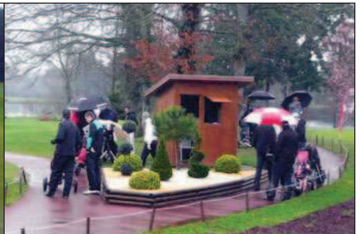
Départ sous la pluie