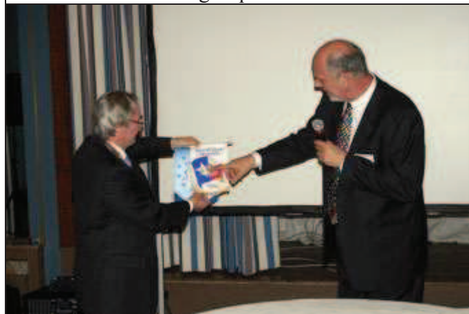
Echange des fanions