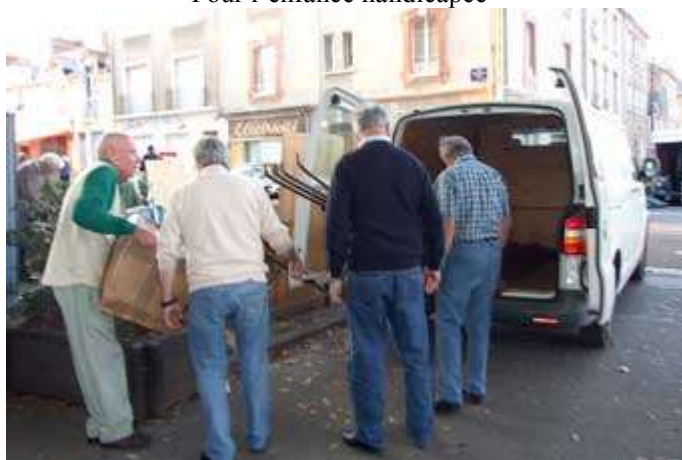
C'est fini. On remballe.