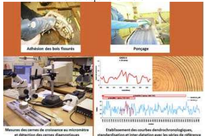
Laboratoire : analyses des cernes de croissance