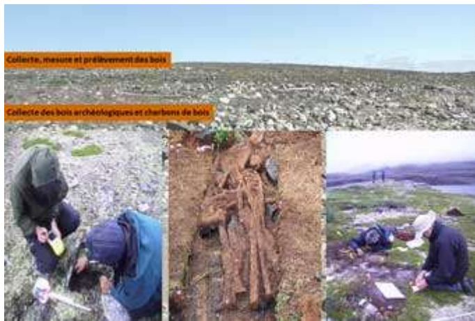
Point d'étape Terrain 2010