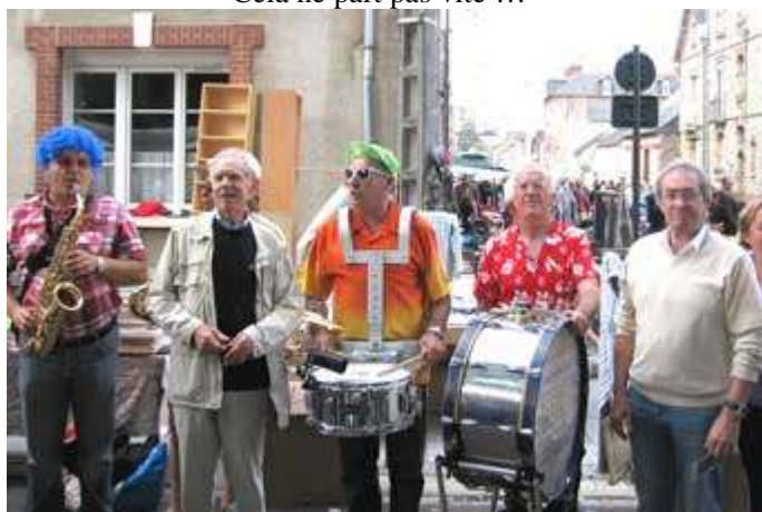
Aubade des Cheminots Rennais