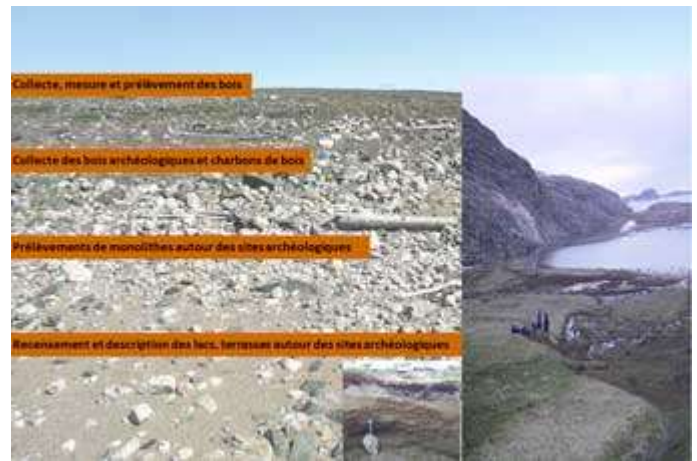
Point d'étape Terrain 2010