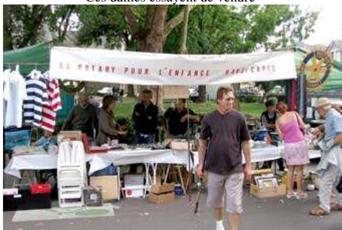
Pour l'enfance handicapée