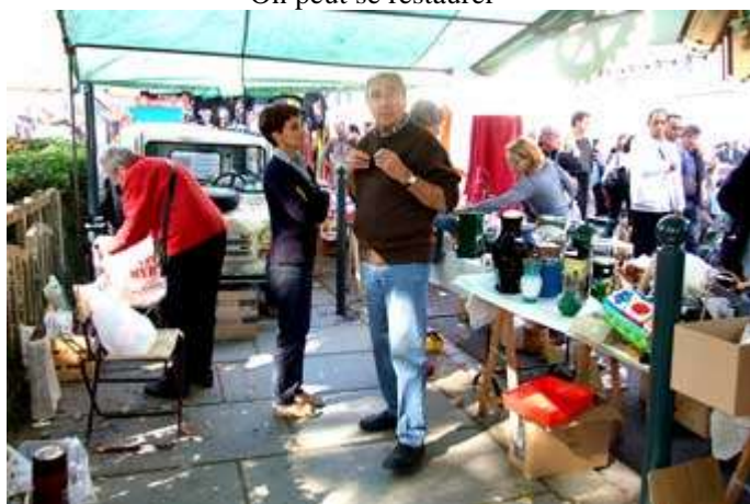
Cela ne part pas vite !!!