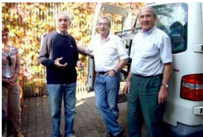
Tout est prêt pour demain