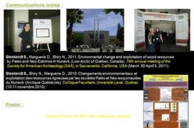
Colloques et séminaires 2010/2011