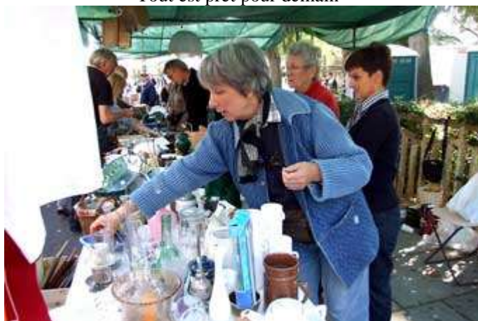
Ces dames essayent de vendre