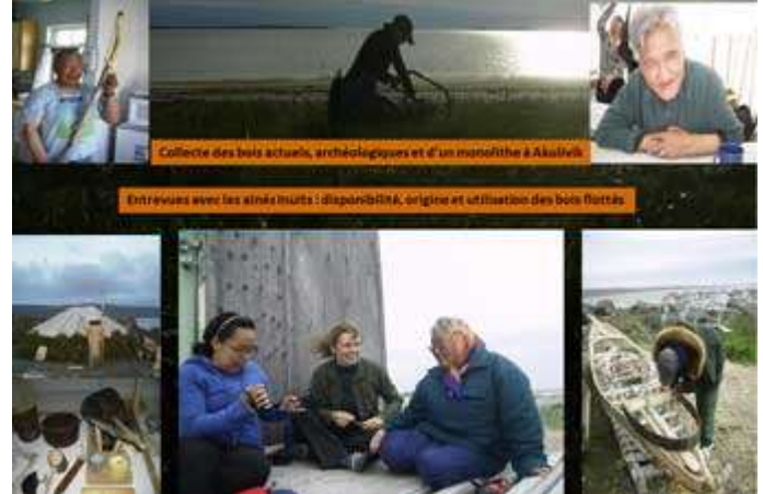
Terrain 2011 : avec les Inuits