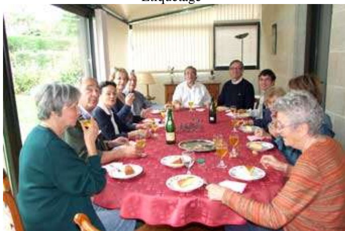
On peut se restaurer